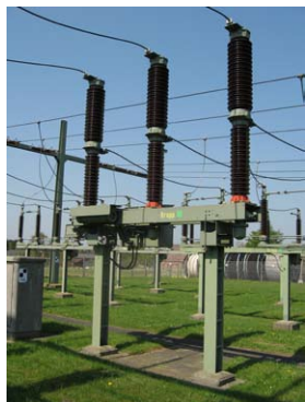
Foto des Leistungsschalters

Das Ergebnis der Dokumentation ist ein detailliertes „As-Built-3D-Modell“, das alle technischen Einrichtungen der Anlage enthält. Aus ihm können dann 2D-Pläne an beliebiger Stelle abgeleitet werden. Weiterhin sind im Modell geplante Umbaumaßnahmen simulierbar.